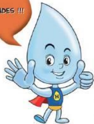
Illustration : Eric Makhrzi - OICOM S - 08.02/4 - 2009.